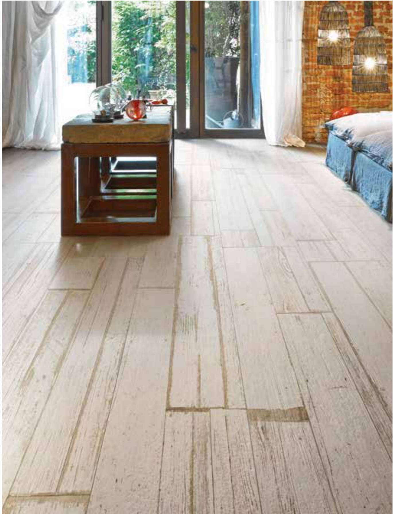
Blendart White Craft