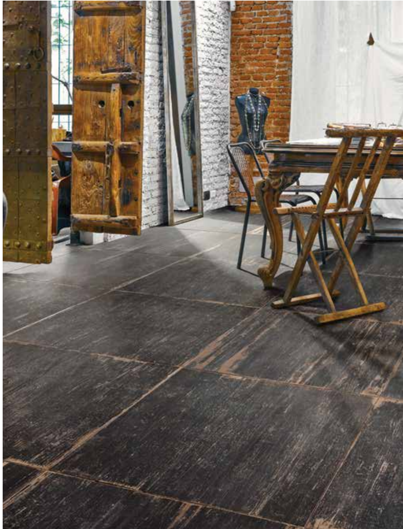
Blendart Dark 9090