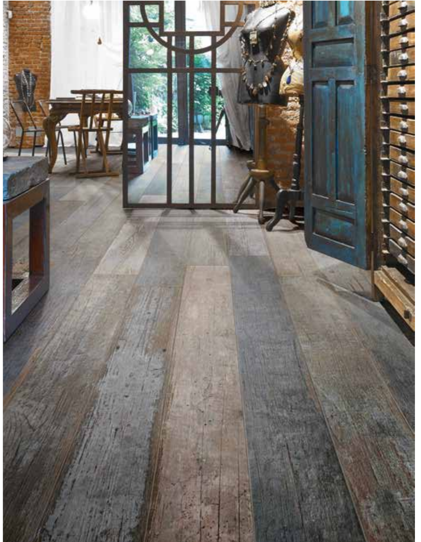
Blendart Mix 15120