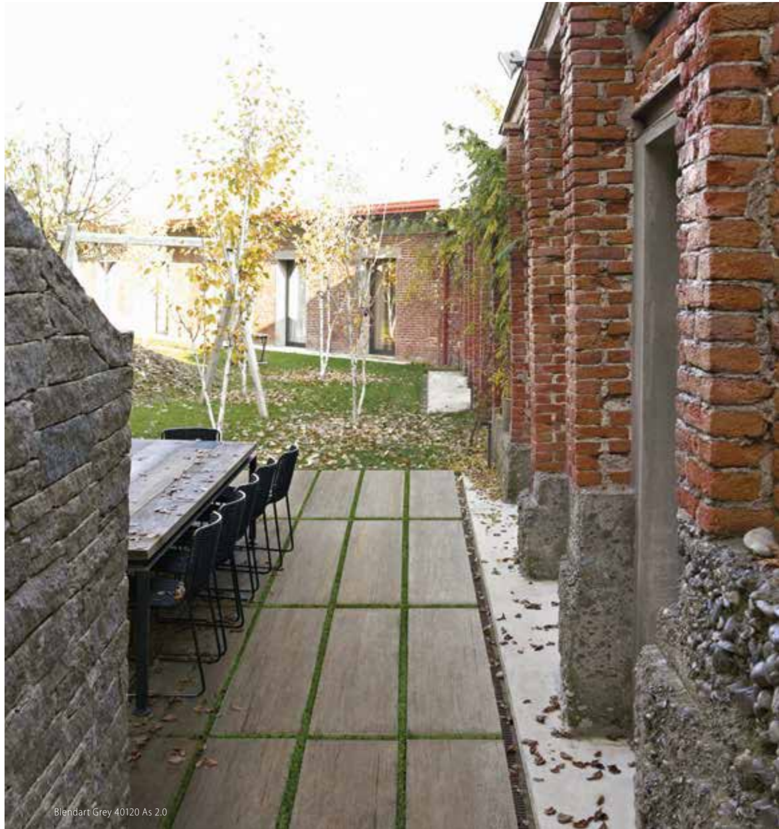
Blendart Grey 40120 As 2.0