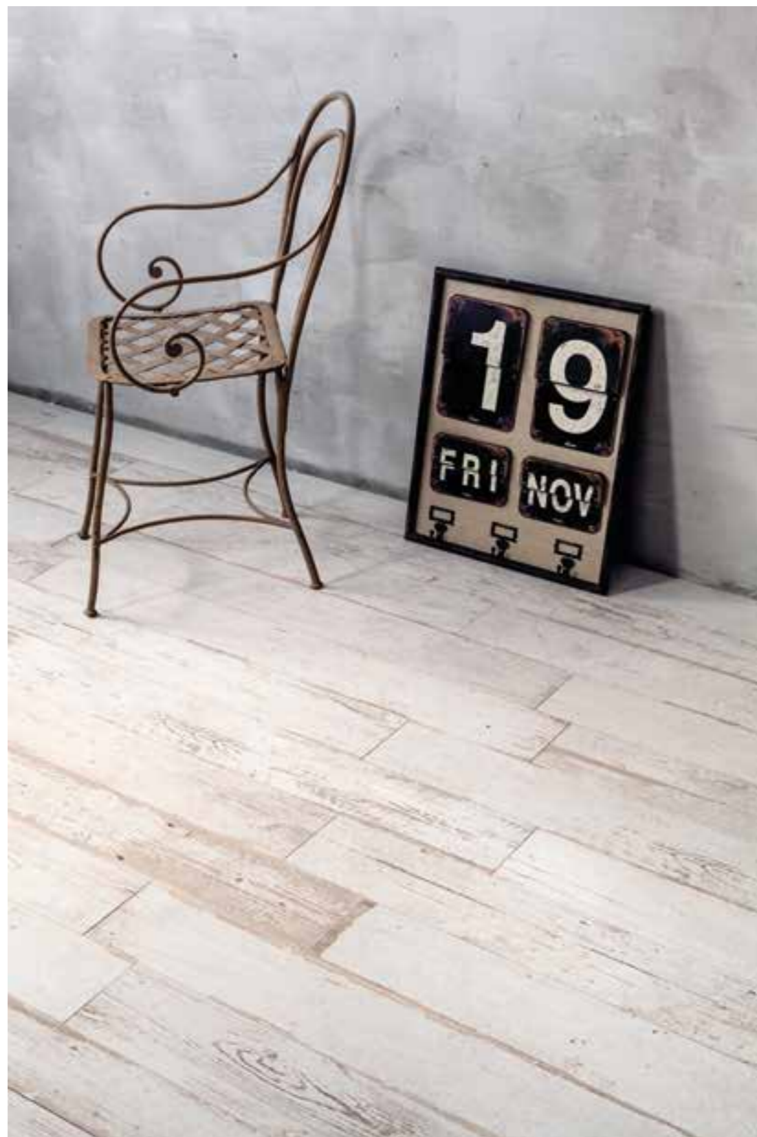
Blendart White 15120