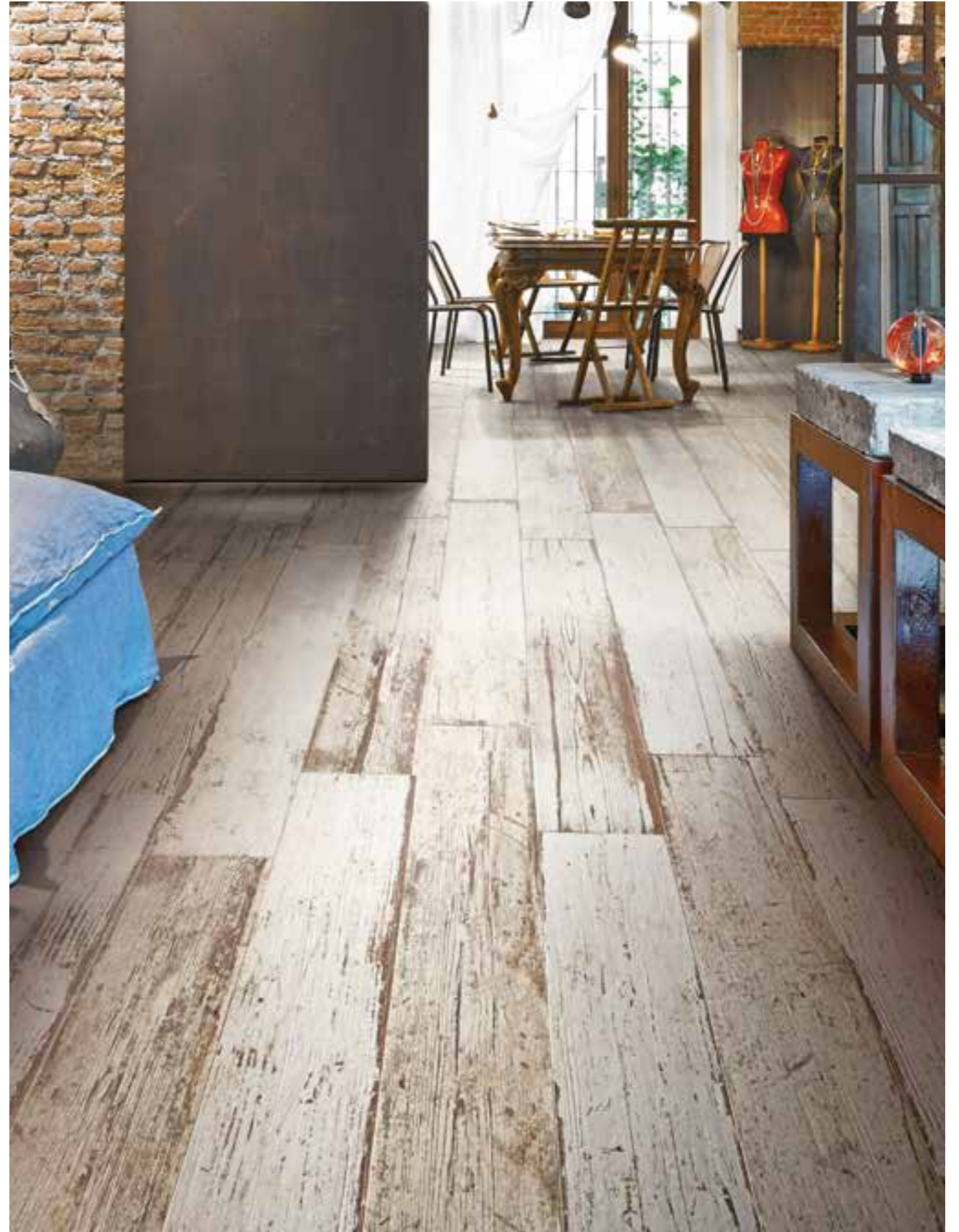
Blendart Natural 15120