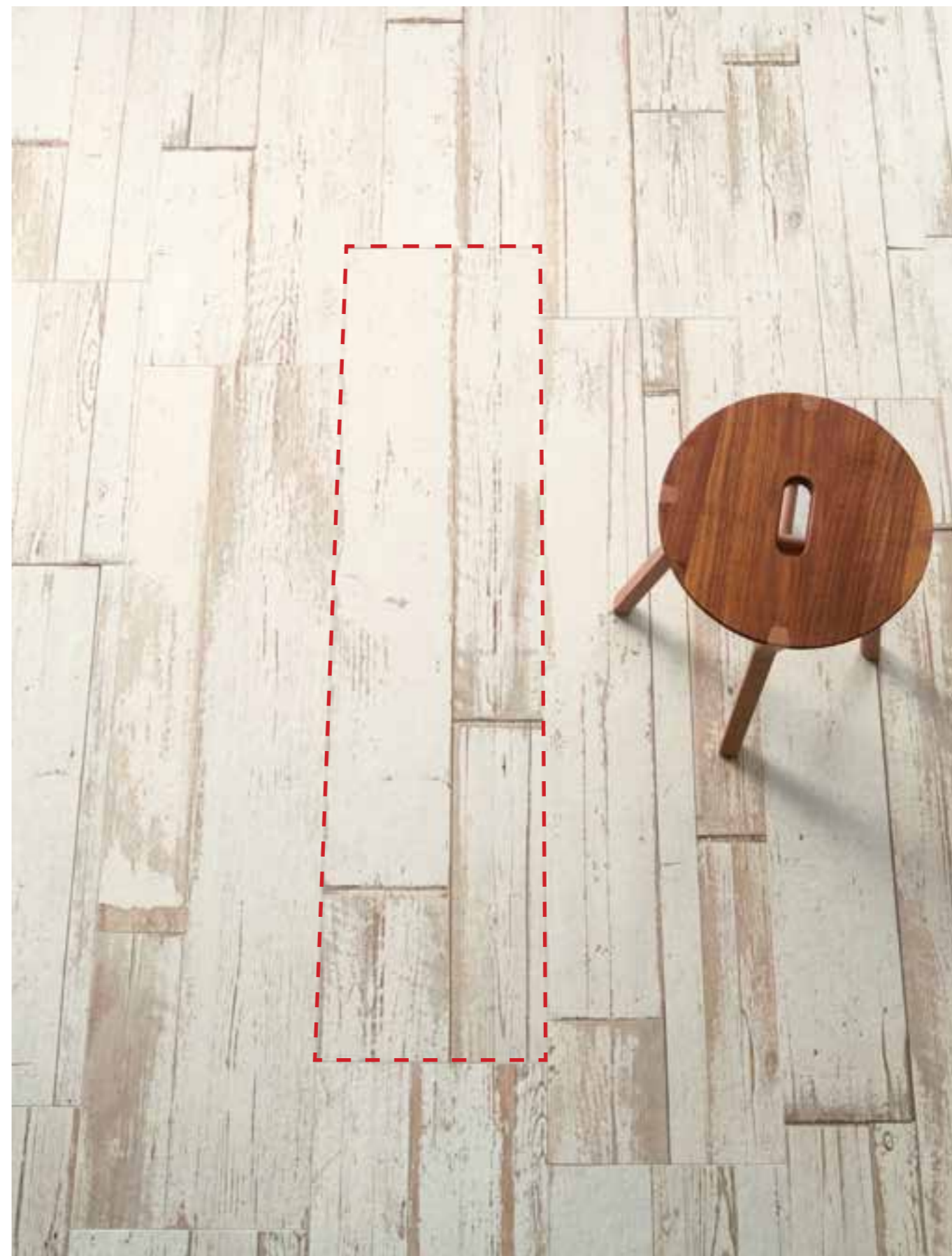
Blendart White Craft

CRAFT - это уникальная плитка размером 30x120 см - 12"x48", характеризующаяся графическим оформлением, которое воспроизводит, пропорционируя отпечатки и оттенки, комплекты валиков различных размеров для создания композиций с ярко выраженным художественным эффектом. CRAFT, таким образом, становится самой что ни на есть настоящей системой, для которой данное исключительное графическое и цветовое движение превозносится во всей своей интенсивности и разнообразии. Благодаря своей укладке, с рекомендуемой прошивкой между одной и другой плиткой примерно в 40 см - 16", на самом деле достигается зрительное восприятие почти безграничных комбинаций и пластического живописного эффекта.